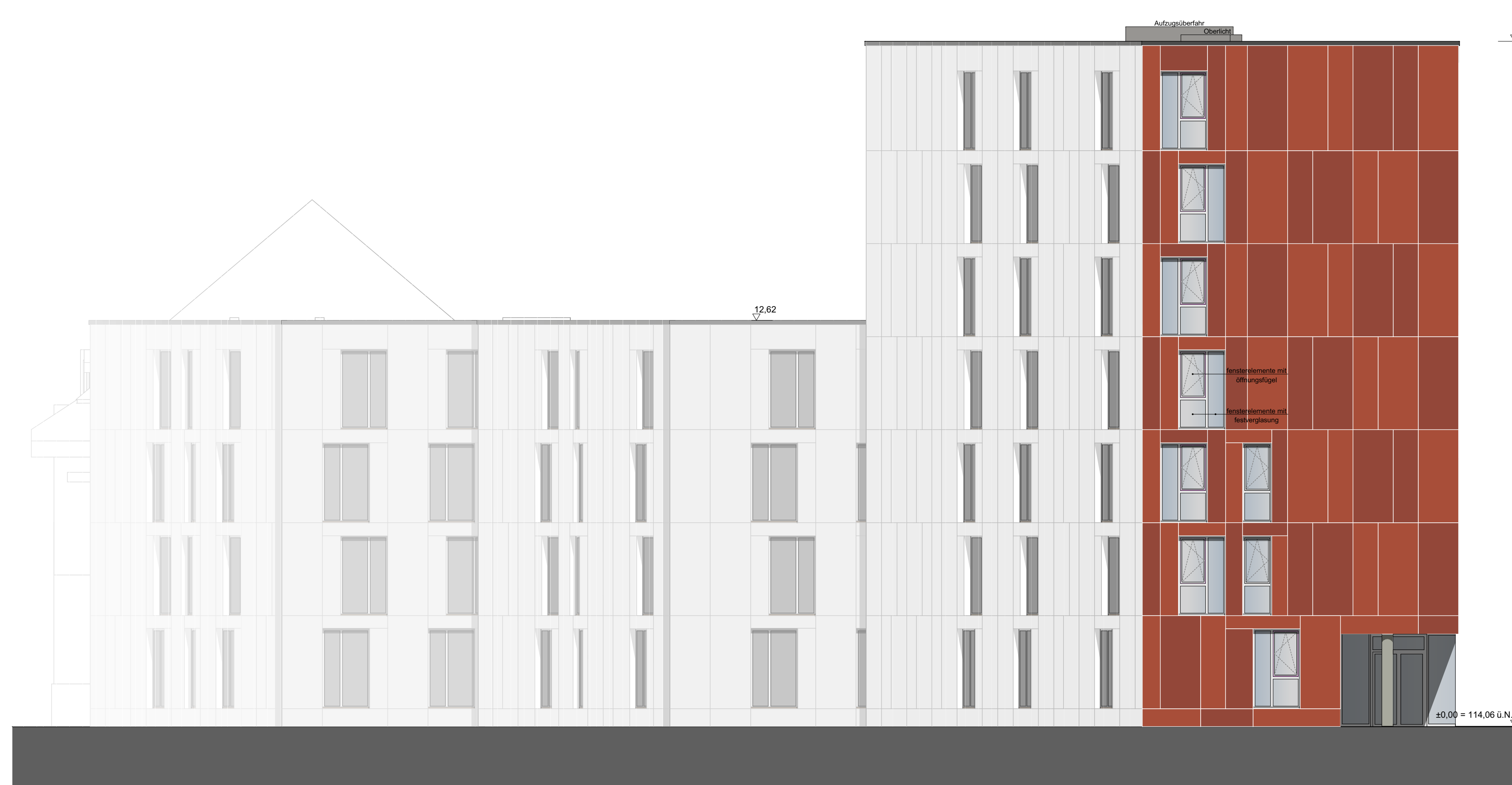
Ansicht Ost BTB