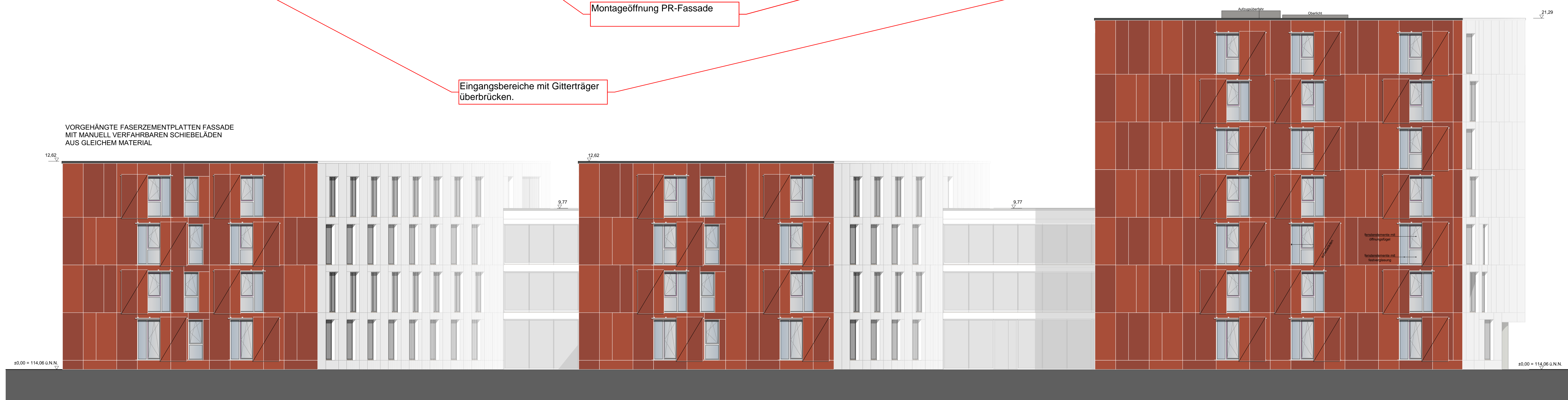
Ansicht Süd BTB