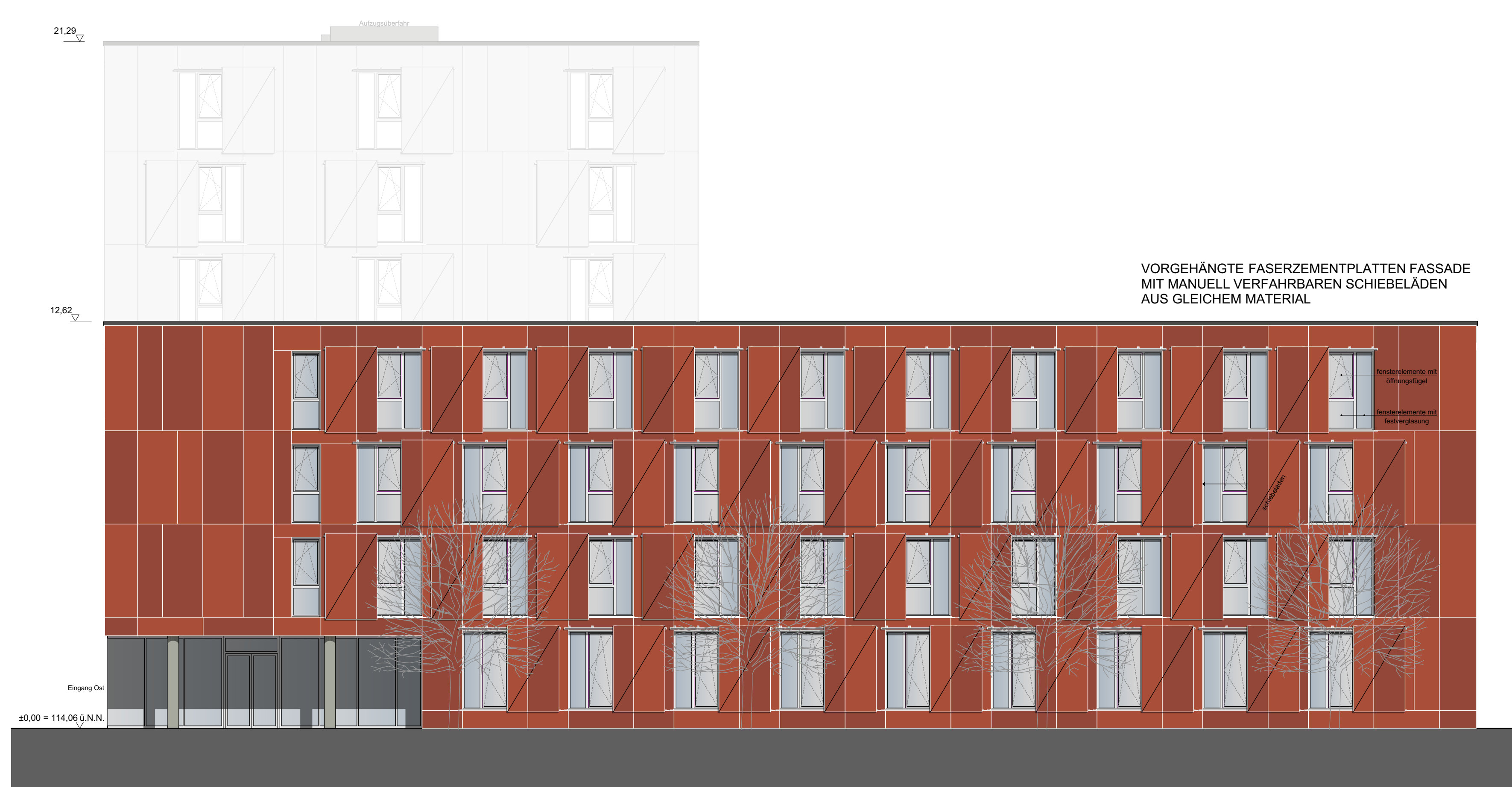
Ansicht West BTB