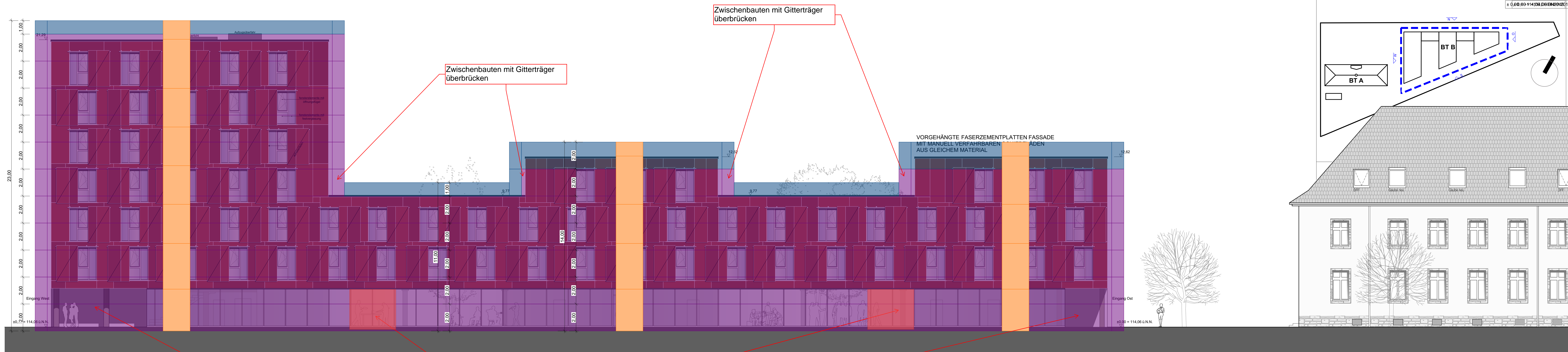
Ansicht Nord BTB